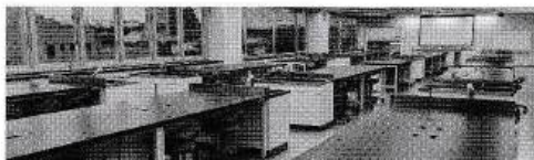
研修を行う 実習室の写真

食品微生物に関する研修は「入門1日」、「初級2日間」、「中級2日間」と順にステップアップする内容ですので新入社員研修やスキルアップ研修に最適！