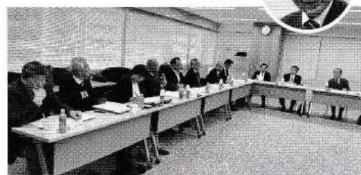
普及啓発事業委員会 会議風景