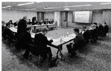
福利厚生委員会 会議風景

令和6年10月に稼働いたしました「食品営業賠償共済」Web受付システムについて、早期定着・安定化への習熟期間設定の取り組みと、同システムを用いた共済契約の増加取り組みに向けた今後の方向性について協議いただきました。いただいたご意見を参考に、今後も利便性の向上や会員管理など事務受付にとどまらない機能拡張について検討してまいります。