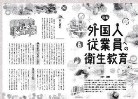
▲月刊「食と健康」2025年3月号特集

また、特集のテーマは、食中毒予防対策・衛生管理・HACCPはもちろん、食品表示や食品ロス対策など、食品業界で注目すべき最新情報を随時掲載。加えて、特集ページをカラーにすることで、図表、写真やイラストがビジュアル的で見やすく、たいへんご好評いただいています。