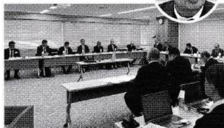
衛生管理推進委員会 会議風景