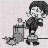
お客様がリュックで商品(土産)を破損した。