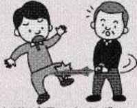
お客様が振り向きざまに傘で別のお客様にケガをさせた。