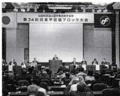
日食協 鶏飼理事長による開会の挨拶