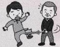
お客様が振り向きざまに傘で別のお客様にケガをさせた。