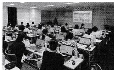
名古屋会場の様子

A4. 令和6年12月始期分(令和6年10月23日振替分)からとなります。現行システムの会費入力欄に金額が入っている場合、同時請求の対象となるため、共済掛金と食協会費の同時請求を希望されない加入者につきましては、現行システムの会費入力欄を「0円」もしくは入力を空白にさせていただきますようお願いいたします。(共済部)