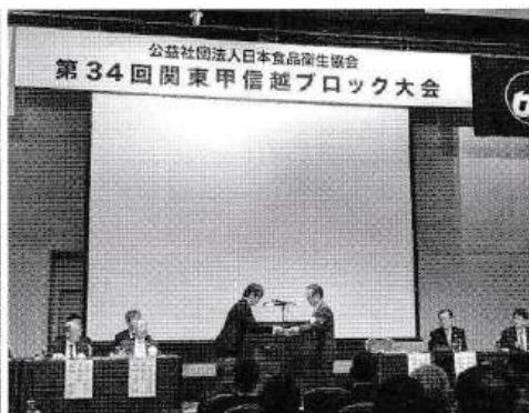
厚生労働省健康・生活衛生局長表彰の授与