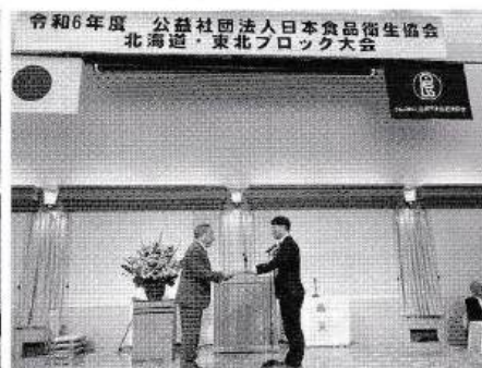
厚生労働省健康・生活衛生局長表彰の授与