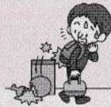
お客様がリュックで商品(土産)を破損した。