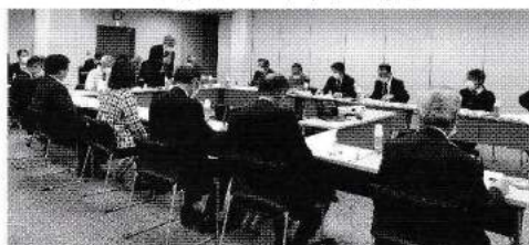
福利厚生委員会の様子

新型コロナウイルスによる休業補償特約の支払い件数・共済金が大幅に増加し、令和3年度以降、食中毒・施設事故等による共済金支払い額を上回り、共済制度の安定運営に影響を及ぼしつつあります。令和5年5月に新型コロナウイルスが「2類」から「5類」へ引き下げられることを鑑み、「新型コロナウイルスによる支払いの今後の対応について」、ならびに「休業補償特約掛金引き上げ」についてご協議いただきました。