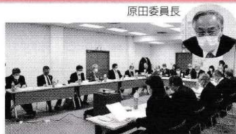
普及啓発事業委員会の様子

日食協では、令和3年度よりeラーニングによる責任者実務講習会のシステムを各支部にご利用いただけるようにし、本年1月からは、日食協制作の動画コンテンツを利用したeラーニング講習会の開催も可能としました。現在のところ、eラーニングによる実務講習会の導入は7支部となっており、今後多くの支部に導入いただけるよう、各支部の実務講習会開催状況や受講率向上のための取組みについてご協議いただきました。