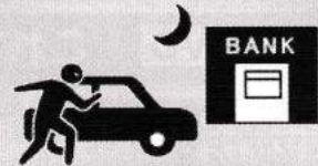
銀行夜間金庫への輸送時、 施錠した自動車内からの現金盗難