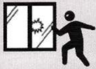
営業時間終了後の 店舗侵入・現金盗難