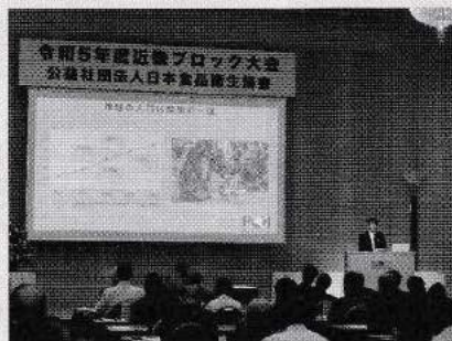
近畿ブロック: 特別講演の様子