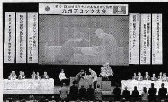
九州ブロック: 厚生労働省医薬・生活衛生局長表彰 授与