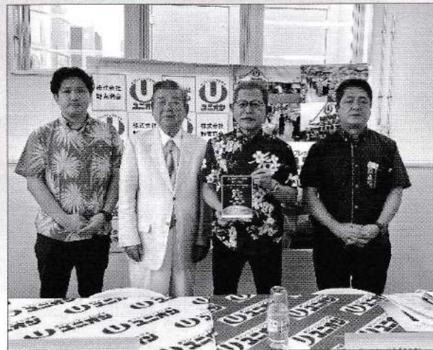
プレスリリース（報道発表）の様子