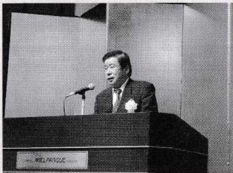
東海北陸ブロック: 食品衛生指導員体験発表