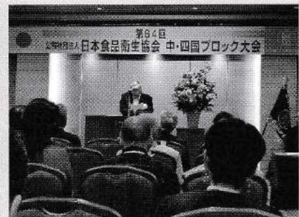
中・四国ブロック: 開会のあいさつ