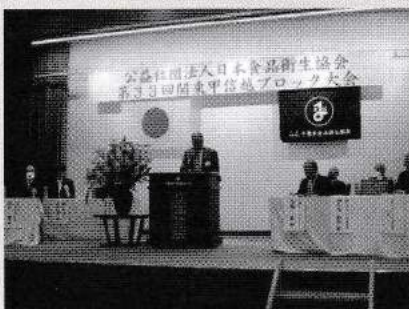
関東甲信越ブロック: 開会のあいさつ