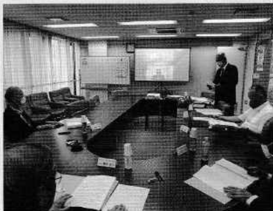
リモートを活用した選考委員会の様子